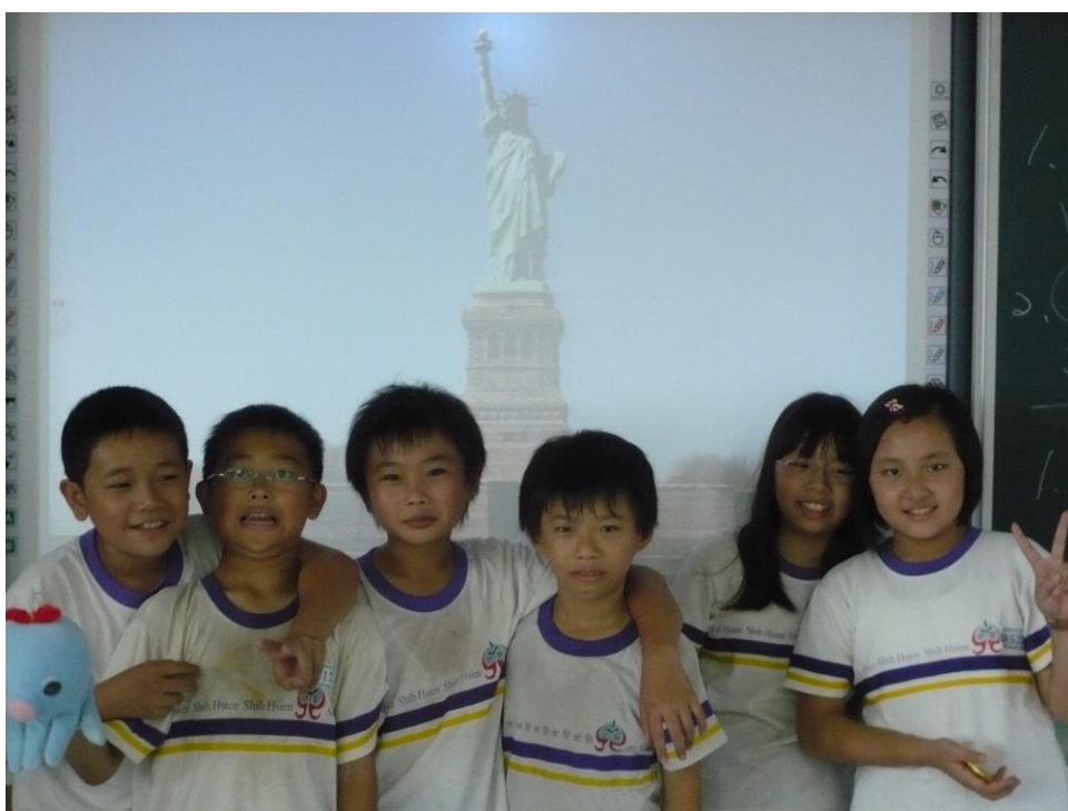
▲照片七：免死金卡「漫遊卡」兌獎現場—與班偶於美國景點留影。

集點獎勵之獎項分為實質獎賞與社會性獎賞。我曾結合級任導師的班費資源，與導師溝通後使用部分班費購置文具小物作集點兌換之獎品。亦可結合校內榮譽制度，將得分合併計算在學校榮譽卡中，省時又省錢。當然，社會性獎賞才是王道，畢竟現代孩子資源豐富，部分孩子並不珍惜得來的文具獎品，因此我設計了一套「免死金卡」，內容屬於課堂上教師賦予的「特權」，如：加分卡（小考加十分）、閱讀卡（可借閱一本英語繪本一週）、免試卡（免除一次小考）、漫遊卡（與班偶至世界著名景點合照，並可獲得紀念此相片一張）、數位卡（使用電腦一次）、座位卡（可自己選座位）、優點卡（全班對你說一句讚美的話）等。將獎項兌換以抽抽樂形式辦理，利用抽獎過程所得之驚喜、新鮮感，督促學生埋首集點不著痕跡。另也別忘了在獲得「免死金卡」後，階段性表揚優秀學生，並將名單張貼於公布欄與班級網頁，這些「殊榮」將會是他下一個進步的動力。