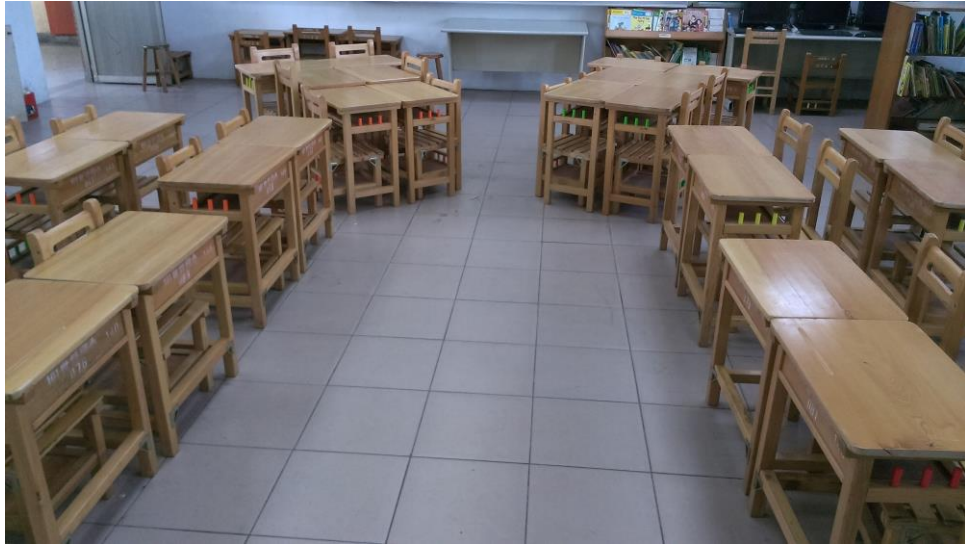
▲照片六：馬蹄形的座位安置。