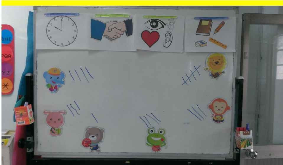
▲照片三：將課規以圖示公布在教室前方顯眼處，時時提醒學生。（下方為分組計分）

位的習慣；上課不背書包，因此所有相關書本及文具，下課就要備齊。從原屬教室到科任教室步行所花費的時間，也是學生要再度調整並努力習慣的。又，學語言講求多聽多講，因此課堂上會有大量且多元的同儕合作與互動，學生時靜時動，必須要靠團隊制約，進行活動時才能避免失序。綜合以上各點歸納出我的課室規定：準時（鐘響五分鐘內到達）、熱心協助同學、認真參與課程、帶齊簿本與文具等。班規細項可與學生一一討論，達成共識後就要徹底執行，如此才能走得長久。