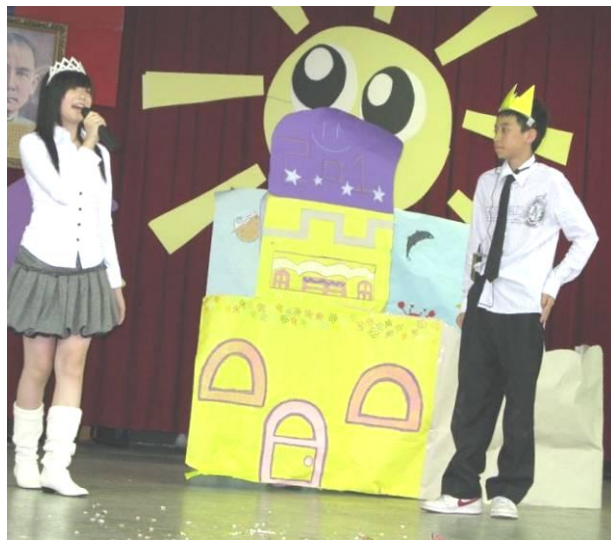
(英語話劇表演照片-The Little Mermaid)