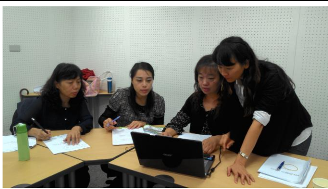
共同修改共備共學教案