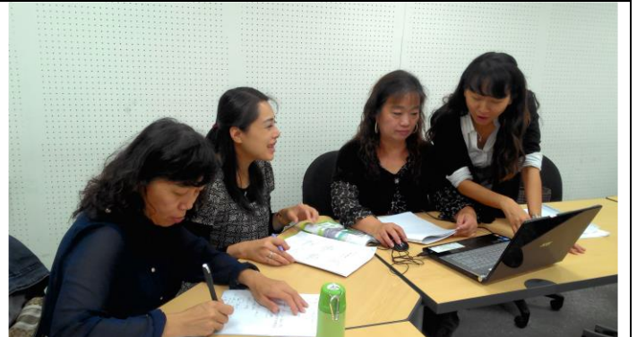
團員討論與分享實際應用於教學的方式